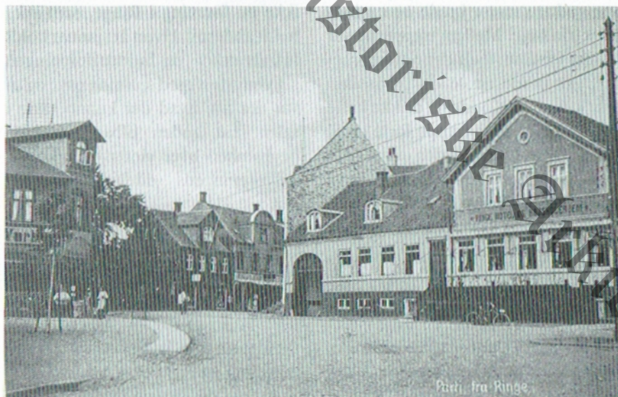
Parti fra Ringe.

Lidt om hvordan hotellet så ud dengang. Den nuværende salfløj var med scene og bagtil — mod øst — en højere afdeling, kaldet højenloft. Den største forandring i denne fløj i det omtalte tidsrum skete sidst i trediverne. Da blev der hugget vindueshuller i kælderen. Det foregik med hammer og mejsel, og derefter blev der gravet ned ved grunden og støbt ekstra grund. Bagefter blev jorden gravet ud gennem vindueshullerne, et arbejde, der krævede sin mand. I hele salen og på scenen blev der lagt