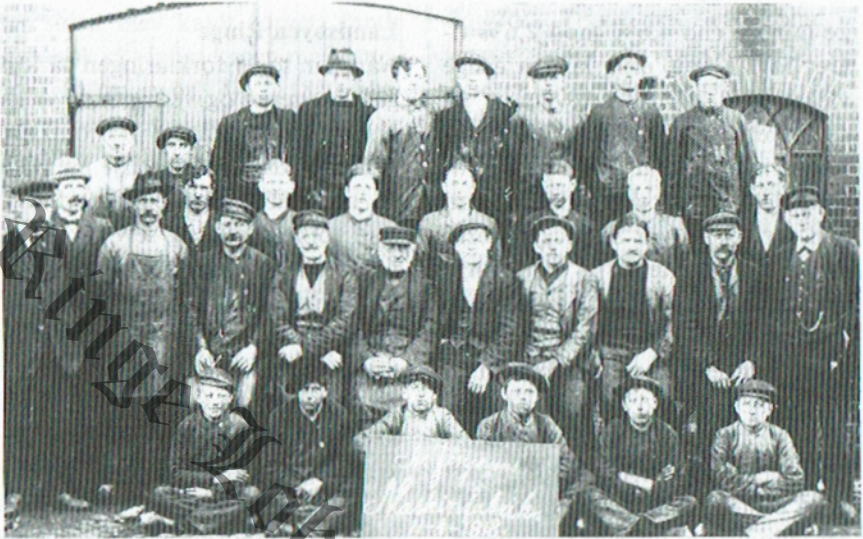
A. Jørgensens Maskinfabrik, personalet 1918.

En beskrivelse af befolkningsudviklingen på Ringeegnen er samtidig en beskrivelse af den almindelige tendens i den samlede danske befolkningsudvikling. Danmarks befolkning voksede overordentlig stærkt i 1800-tallet. Næst efter England havde Danmark den kraftigste befolkningstilvækst i Europa i 100-året mellem 1800 og 1900. I første halvdel af 1800-tallet faldt næsten hele væksten på landdistrikterne (og København). Efter 1860 begyndte billedet imidlertid at vende. Befolkningen voksede stadig — med over 1% om året — men landbruget kunne ikke længere beskæftige det hastigt voksende befolkningsover-