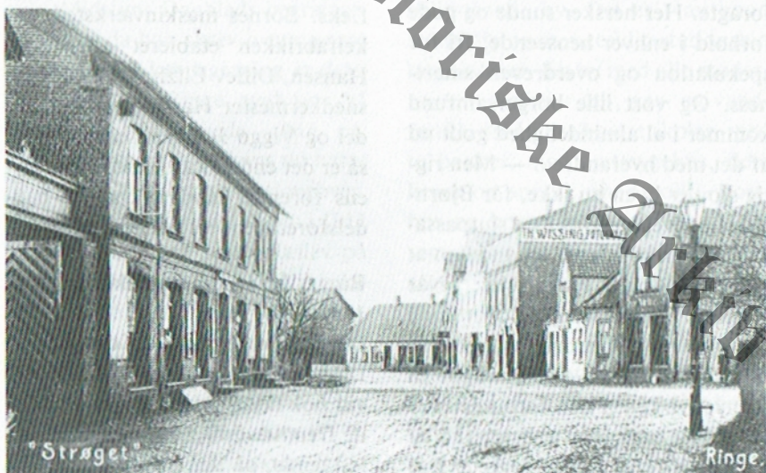
»Strøget«, Algade - ca. 1900

Betragter man det 3.466 ha store Ringe sogn, som indtil 1970'ernes kommunesammenlægning er den uforandrede geografiske enhed, fremgår det, at indbyggertallet i de 160 år mellem 1800 og 1960 er blevet næsten firedoblet. Væksten er dog tydeligvis ulige fordelt på land og by, thi mens Ringe by er vokset fra 179 indbyggere i 1840 til lige knap 3.000 i 1960, er befolkningstallet i de omgivende landdistrikter efter 1834 næsten uforandret — og fra 1930 boede der flere mennesker i byen end på landet. I det åbne land er der foregået en vis vækst i 1800-tallets første halvdel, mens befolkningstallet på landet i 1860 og 1960 er omtrent det samme, henholdsvis 1.805 og 1.814 indbyggere.