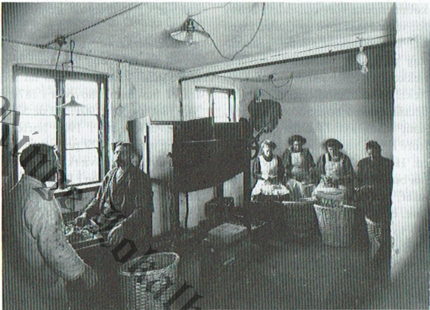
»Der sorteres propper«, ca. 1910