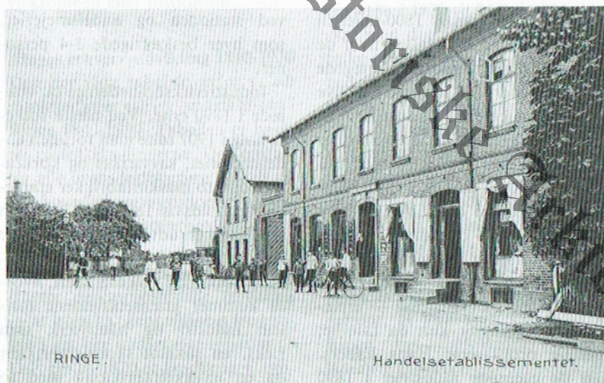
Ringe Handelsetablisement, ca. 1890'erne

Hvornår industrien for alvor slog igennem i Ringe kan vel diskuteres. Men først i 1911 ernærede industrien den største befolkningsgruppe i byen. Som i så mange andre nye byer er der tale om en flydende udvik-