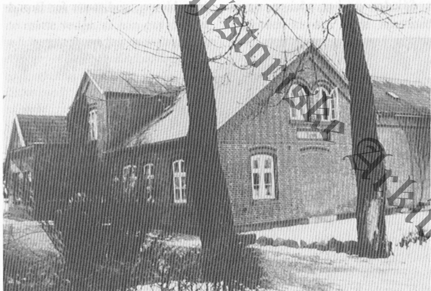
»Hjemly« ca. 1955