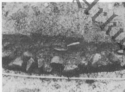
ill. 1: Ildsted under udgravning på Rynkebygård